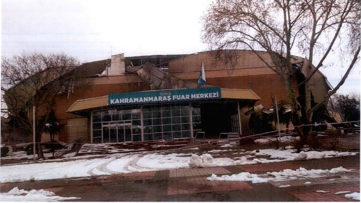
Resim-1: Çatı Sökümü Yapılacak Olan Bina.