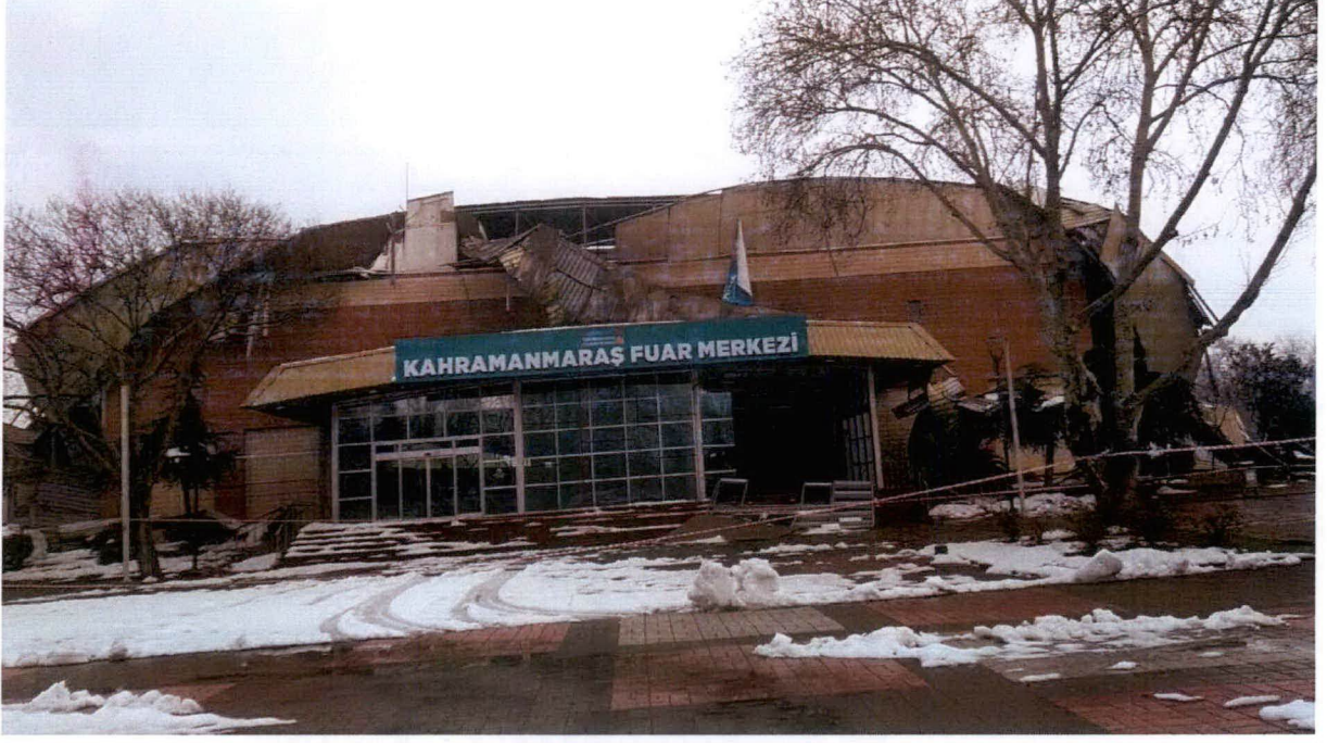
Resim-1: Çatı Sökümü Yapılacak Olan Bina.