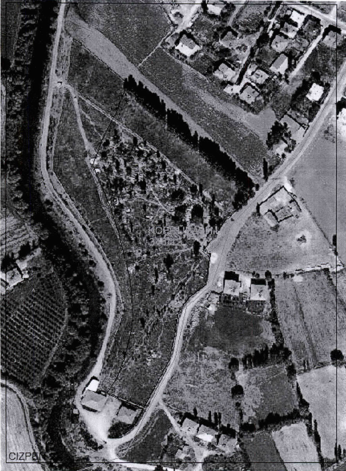
Resim-1 Kerpetenlik Mezarlığı (Kavak Ağaçlarının Kesileceği yer)