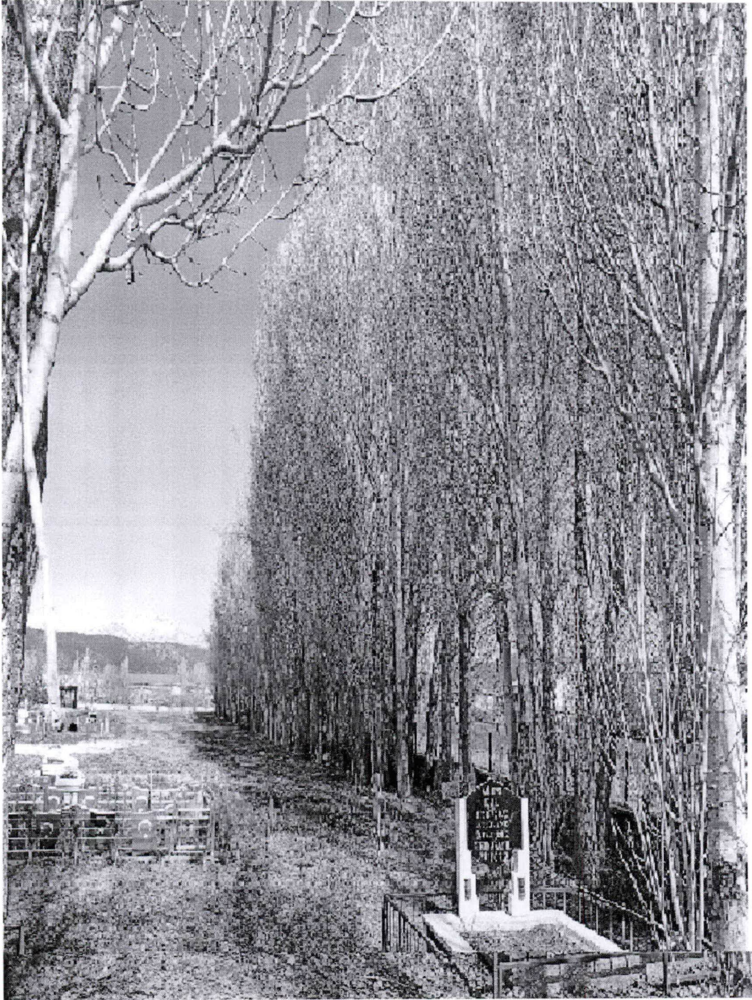
Resim-3 Kerpetenlik Mezarlığı (Kavak Ağaçlarının Kesileceği yer)