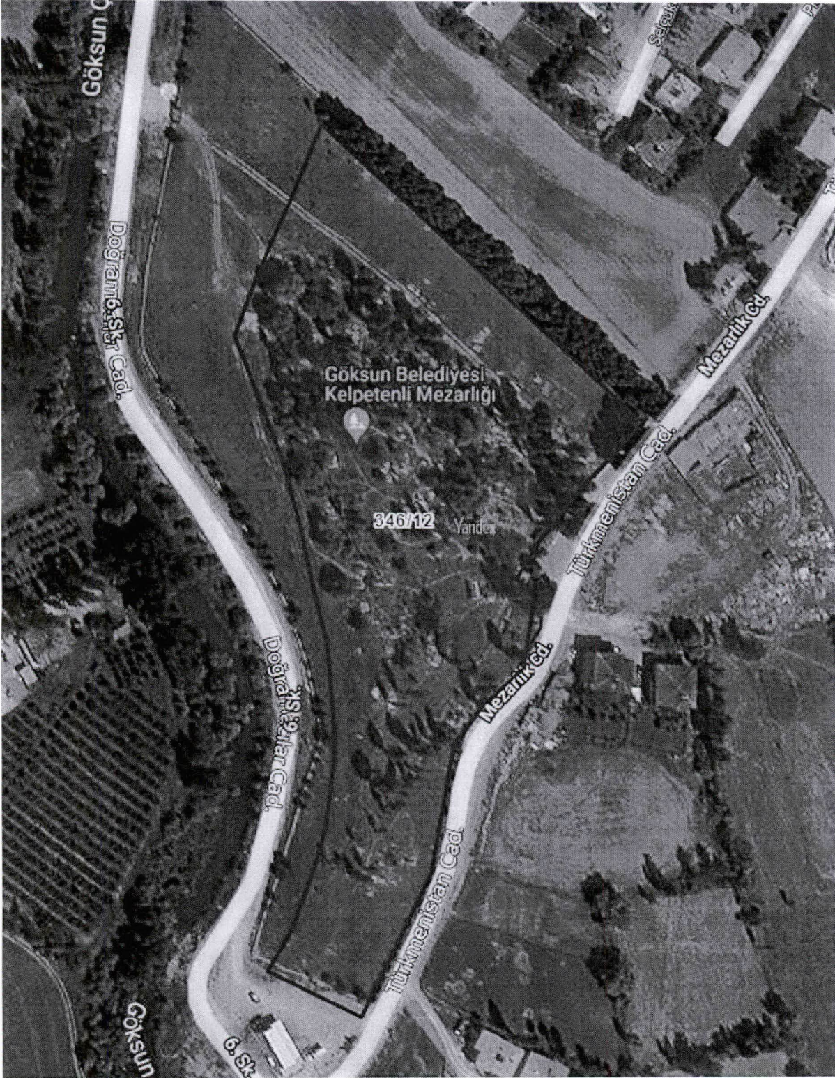
Resim-2-Kerpetenlik Mezarlığı (Kavak Ağaçlarının Kesileceği yer)