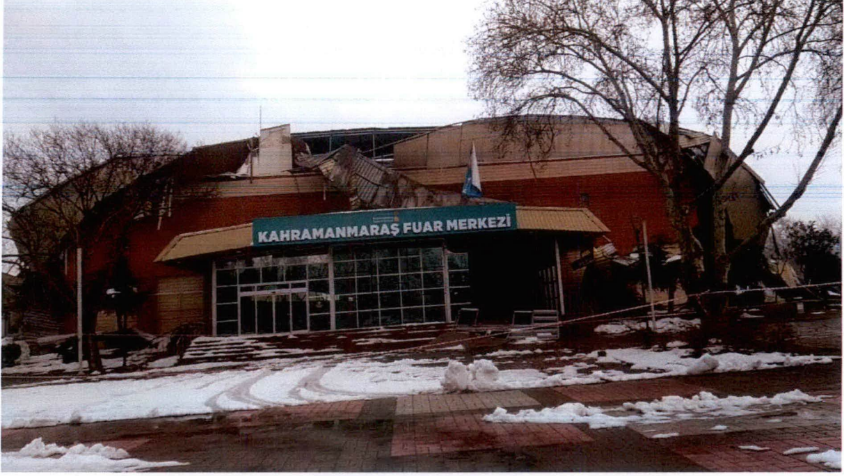
Resim-1: Çatı Sökümü Yapılacak Olan Bina.