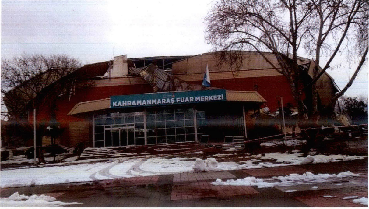
Resim-1: Çatı Sökümü Yapılacak Olan Bina.