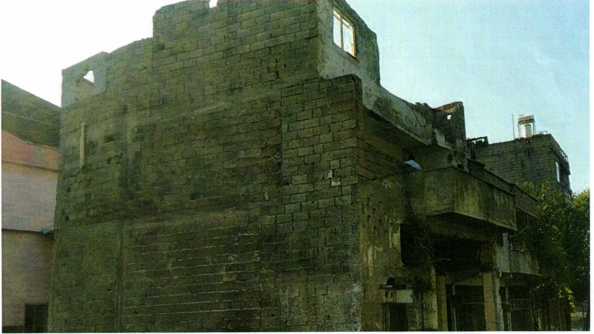
Resim-2: Yıkımı gerçekleştirilecek yapılardan olan Kahramanmaraş İli Dulkadiroğlu İlçesi İsadivanlı Mahallesi 304 ada 112 numaralı parseldeki (İsadivanlı Mah. Güllü Hoca Cad. No: 48) bina.