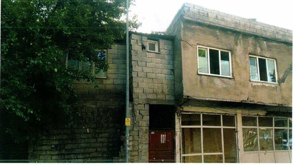
Resim-1: Yıkımı gerçekleştirilecek yapılardan olan Kahramanmaraş İli Dulkadiroğlu İlçesi Turan Mahallesi 1736 ada 10 numaralı parseldeki (Turan Mah. Ş. Haseoğlu H. İbrahim Cad. No: 21) bina.